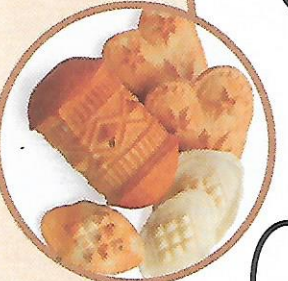
oscypek – ser wędzony