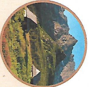
baciówka – dom pasterzy